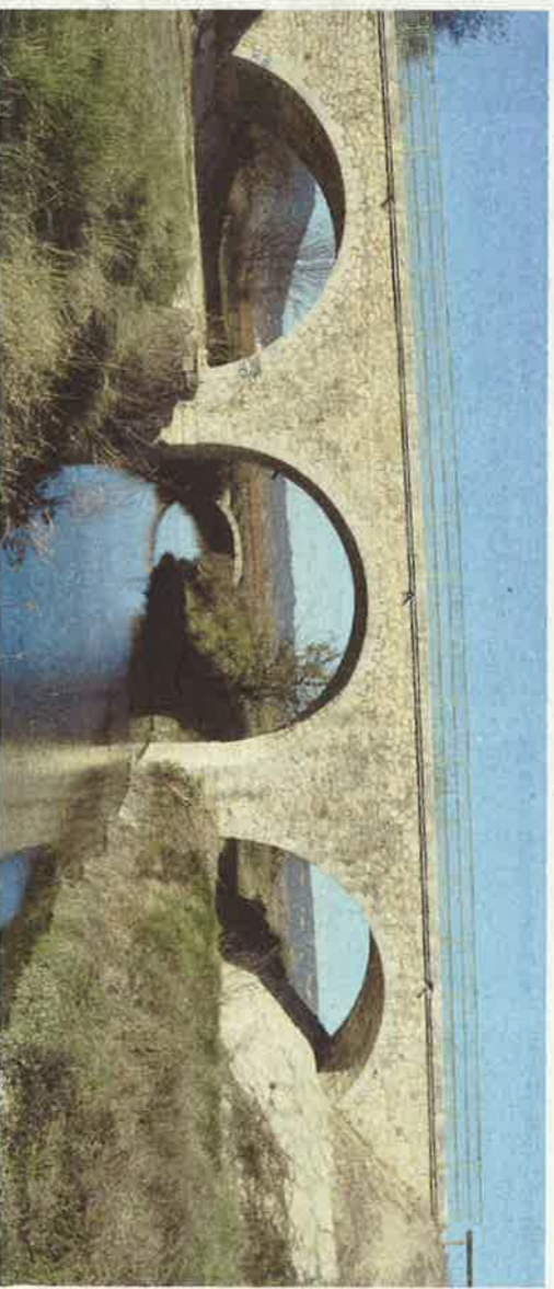
Pont ferroviaire sur la ligne de chemin de fer qui reliait Nîmes à Sommières entre 1882 et 1987, devenue une voie verte.