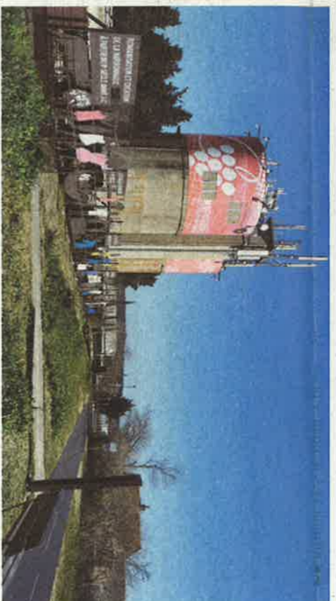
Ci-contre et ci-dessous, le Vinorama depuis la voie verte.