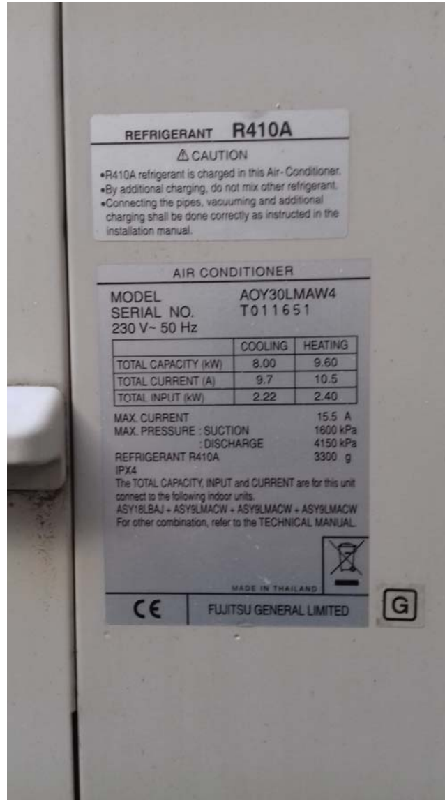
2 Unités Ext. de Climatisation au RdC au sol à Gauche dans Cour