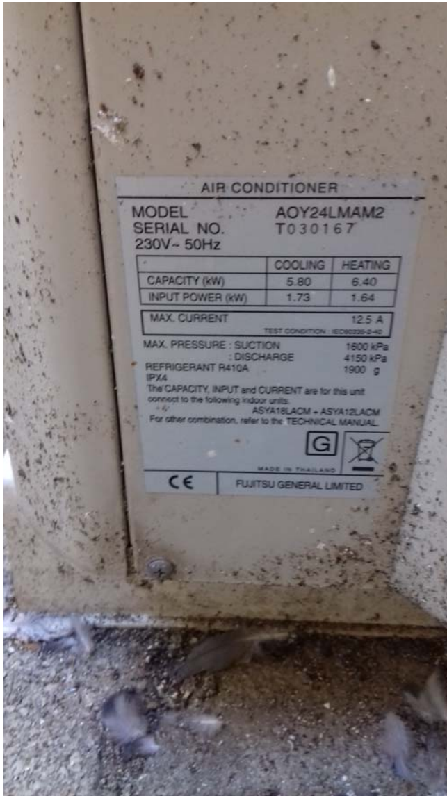
2 Unités Ext. de Climatisation au RdC au sol à Droite dans Cour